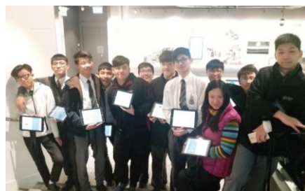
本校為教育局 wifi-100 的先導學校，現正積極發展電子學習。圖中為老師利用平板電腦促導地理考察的情況。