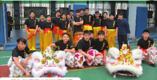
▲ 醒獅隊積極參與社區活動