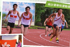
喇沙會聯校運動會

本校與同屬香港喇沙會的喇沙書院、聖若瑟書院等為兄弟學校，聯繫密切。本校學生每年均會參加香港喇沙青年運動計劃、喇沙交換生計劃及喇沙聯校運動會等，以與香港喇沙會屬下的其餘四所中學的學生作學術、運動、文化等交流。而本校老師亦會參與亞太區喇沙教育工作者會議，作為教育理念、教學方法的更新交流。