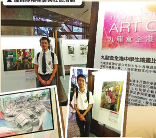
▲ 梁氏昆仲在全港性繪畫比賽中表現優異