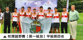
▲ 校際越野賽（第一組別）甲組第四名