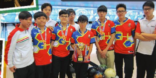
▲ 校際保齡球賽近年分別奪得全場冠軍及個人優異成績