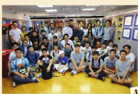
▲ 初象·十五高中視藝展