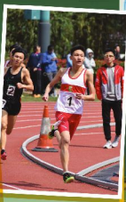
▲ 在校際田徑賽（第一組）中為校區奪獎牌的運動員