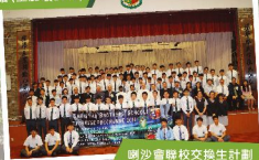
喇沙會聯校交換生計劃